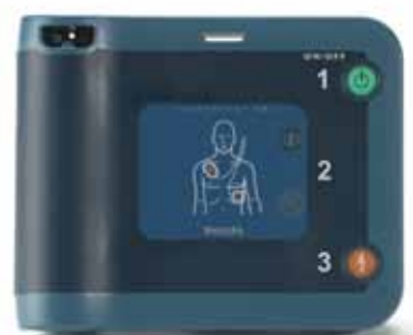
HeartStart FRx AED