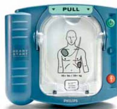
HeartStart Eerste Hulp AED